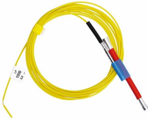
Abb. 2: Richtig montierter nichtelektrischer Sprengzünder

Es ist daher wichtig, dass der Sprengzünder mit dem vormontierten Zünderverbinder richtig und satt am Booster montiert wird (siehe Abb. 2). Besonders ist dabei zu beachten, dass der Zünderboden etwa mittig des Boosters angebracht wird.