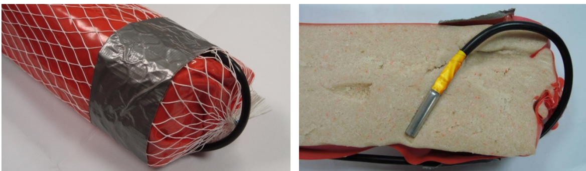
Abb. 1 und 2: Seitliche Anbringung der Sprengkapsel Nr. 8 FALSCH!

Bei der seitlichen Einführung besteht die Gefahr, dass die Sprengkapsel Nr. 8 zu weit in die Sprengstoffpatrone eingeschoben wird (Abb. 3 und 4). Da die Hauptwirkung der Sprengkapsel Nr. 8 in axialer Richtung ausgeht, besteht so die Gefahr, dass der Sprengstoff nicht gezündet wird.